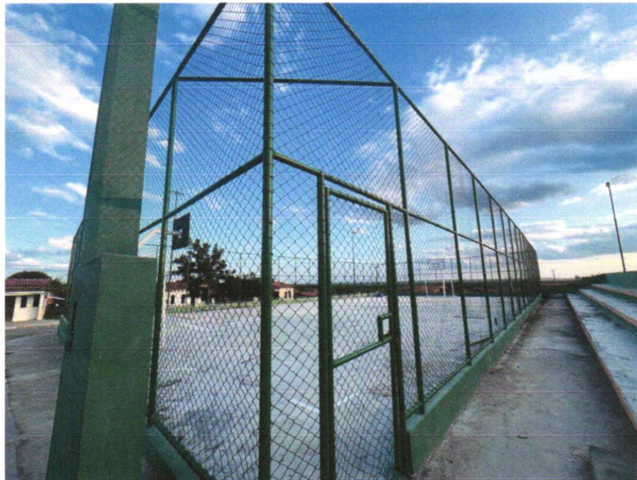
Foto 01 - PISO EM CONCRETO 20 MPA PREPARO MECÂNICO, ESPESSURA 7CM. AF_09/2020