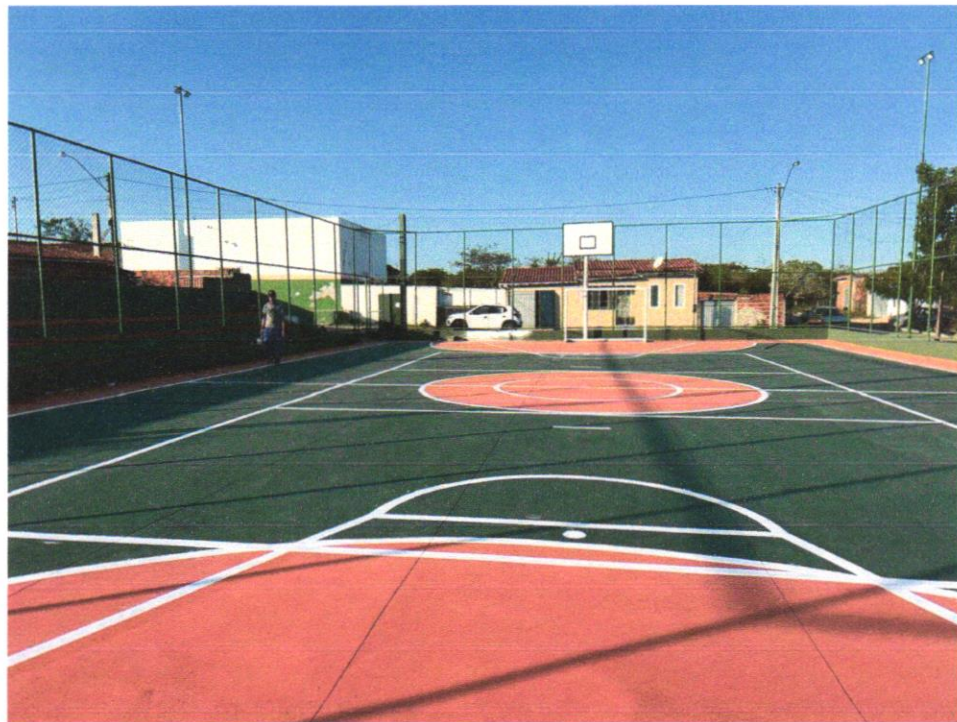
Foto 07 - PINTURA DE PISO COM TINTA ACRÍLICA, APLICAÇÃO MANUAL, 2 DEMÃOS, INCLUSO FUNDO PREPARADOR. AF_05/2021