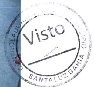
Foto 08 – PINTURA DE PISO COM TINTA ACRÍLICA, APLICAÇÃO MANUAL, 2 DEMÃOS, INCLUSO FUNDO PREPARADOR. AF_05/2021

Evaldo Almeida Moraes Engenheiro Civil RNP 051417303-3