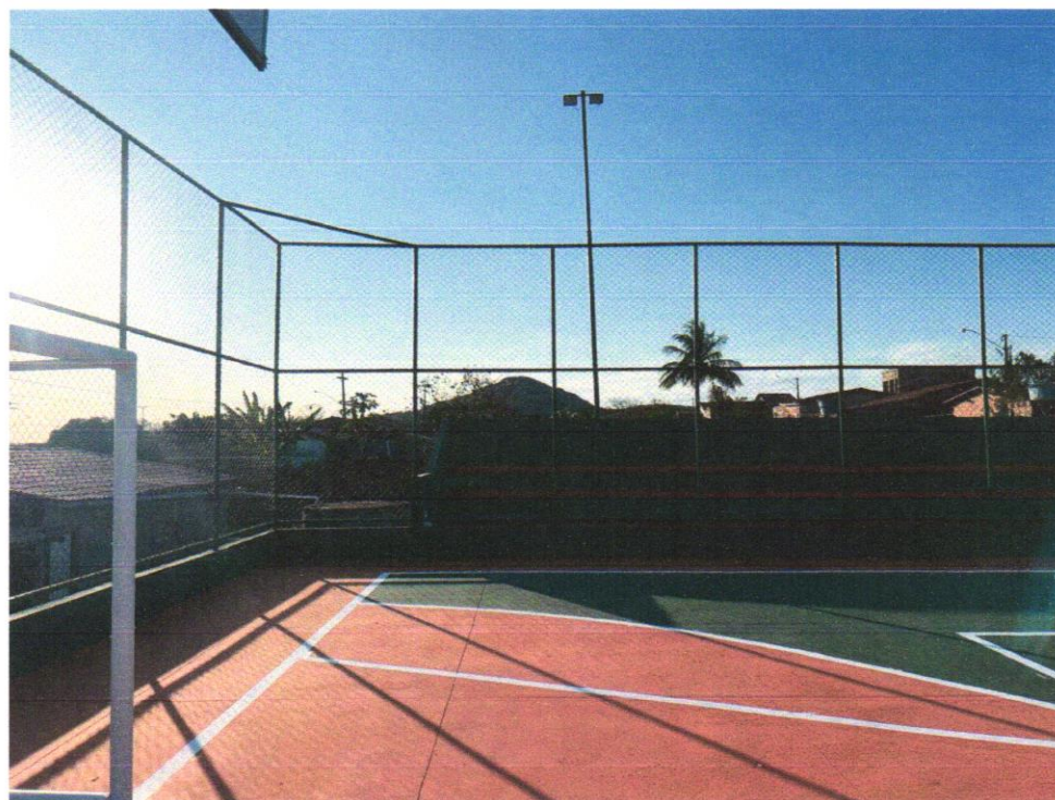
Foto 03 – Refletor Slim LED 200W de potência, branco Frio, 6500k, Autovolt, marca G-light ou simila