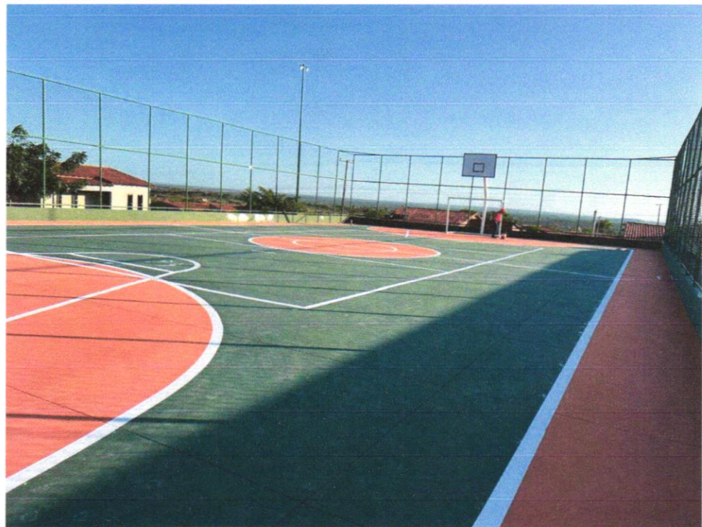
Foto 05 - Estrutura metálica fixa, p/ tabela em aço com aro e cesta p/ basquete, padrão oficial, em tubo galvanizado d=5" - instalada