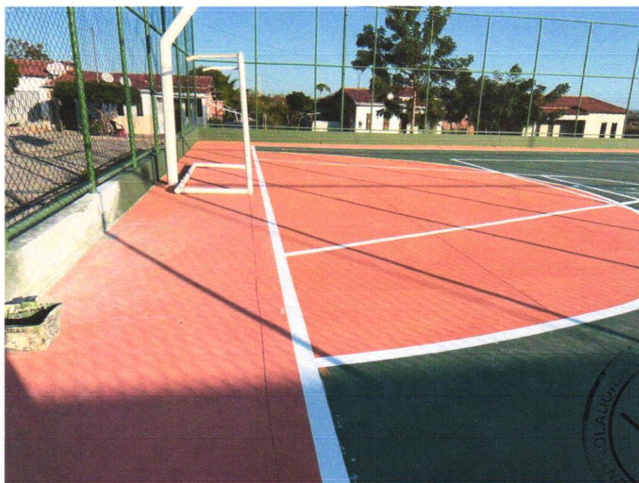
Foto 04- Traves oficial para futebol de salão 3x2m em aço galv.3", com requadro e redes de polietileno fio 4mm (conjunto p/futsal)